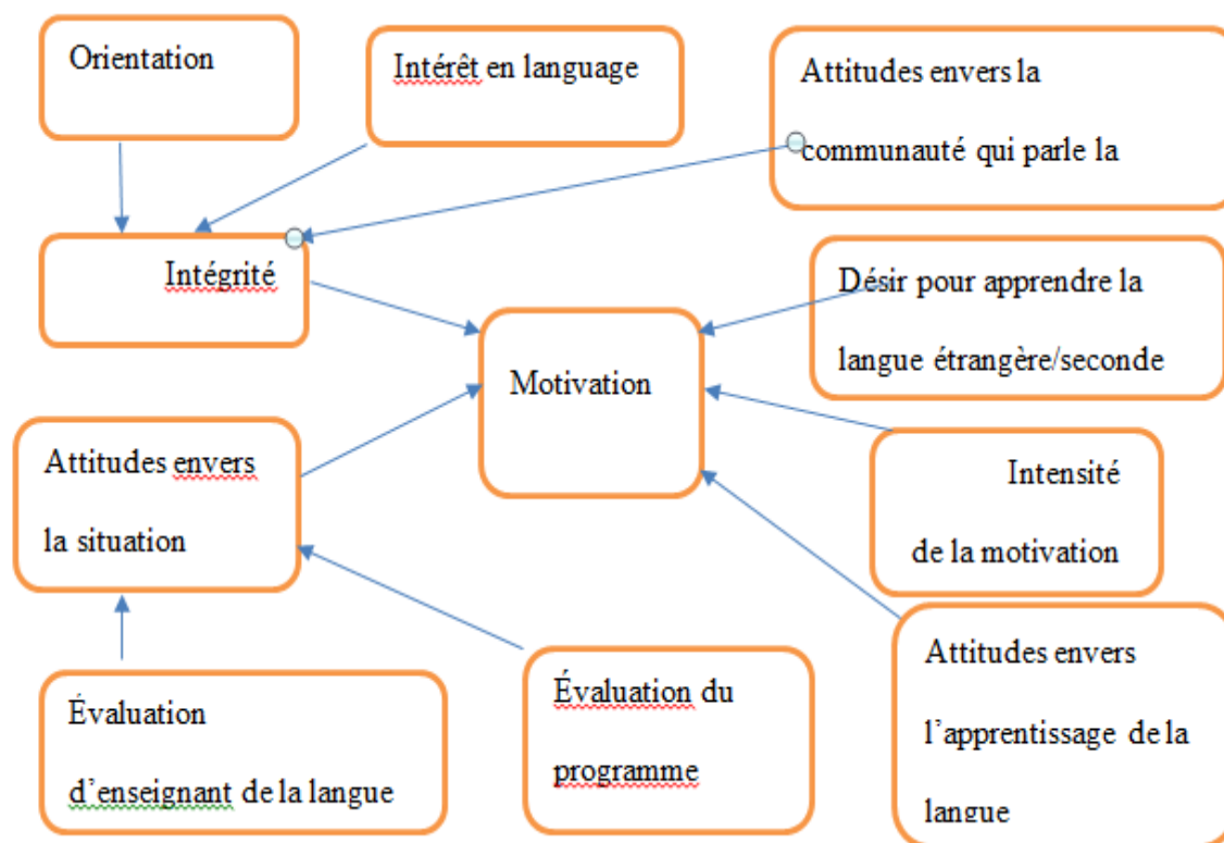
Figure 1.1 LE MOTIF INTEGRATIF

individuelles. Il a divisé le motif intégratif en deux : attitudes envers la situation d'apprentissage et intégrité. Les attitudes envers la situation d'apprentissage impliquent une attitude envers l'école, des réactions aux manuels, une évaluation du professeur de la langue et du cours de langue et autres. La nature de la situation d'apprentissage influence la motivation de l'élève. D'autre part, l'intégrité est l'intérêt que l'apprenant porte au groupe qui parle la langue cible. L'apprenant s'identifie à la communauté et à sa culture. L'orientation intégrative reflète une disposition positive envers le groupe L2 où les locuteurs natifs et le désir d'interagir avec eux et de devenir semblables aux membres de cette communauté.