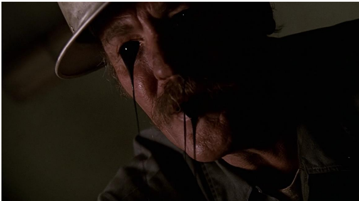
Fig. 4.5. Un trabajador de plataforma petrolífera infectado con el cáncer negro extraterrestre del Golfo de México. The X-Files , "Vienen" (2001).

En este episodio, la tripulación de una plataforma petrolífera estadounidense en el Golfo de México se infecta con el "cáncer negro" o "aceite negro," un virus extraterrestre que ha sido una parte intermitente de la mitología alienígena de la serie desde la tercera temporada (1995-1996). Curiosamente, este episodio combina el virus alienígena del aceite negro con el petróleo por primera vez en el programa. Un trabajador petrolero de nacionalidad mexicana, Simón de la Cruz, asesina a un miembro de la tripulación y comienza a destruir el equipo radiofónico de la plataforma, pero antes de que él tenga éxito, él muere de quemaduras de origen desconocido.