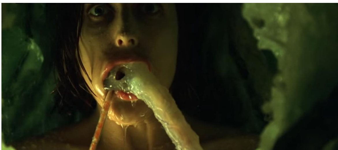
Fig. 2.2 La agente Scully a bordo de un OVNI, conectada al barco por un cordón umbilical. The X-Files: Fight the Future (1998).

temor a la violación por invasores extranjeros, el miedo de un sujeto hípermasculino que penetra a las mujeres y a las fronteras, y el pánico de los nacimientos impuros son ansiedades que se han relacionado históricamente con la presencia de no blancos en los Estados Unidos. Esto se manifiesta en la serie como extraterrestres del espacio exterior.