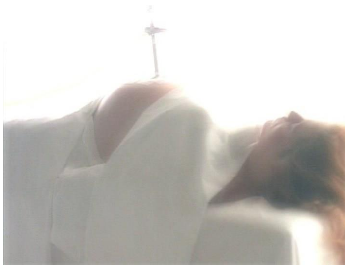
Fig. 2.1. Scully impregnada con un híbrido durante su primer secuestro, The X-Files , “Ascension” (1994).

Kydd sugiere que la amenaza racial de Expediente X es una inversión del eje de poder, a través del cual los euroamericanos sufren las repercusiones principales de la violencia colonial. Las tramas del embarazo y el secuestro femenino son claramente sexuales; la abducción de Scully en particular se caracteriza por escenas oníricas fetichistas que se concentran en su abdomen extendido y su cuerpo penetrado por aparatos médicos.