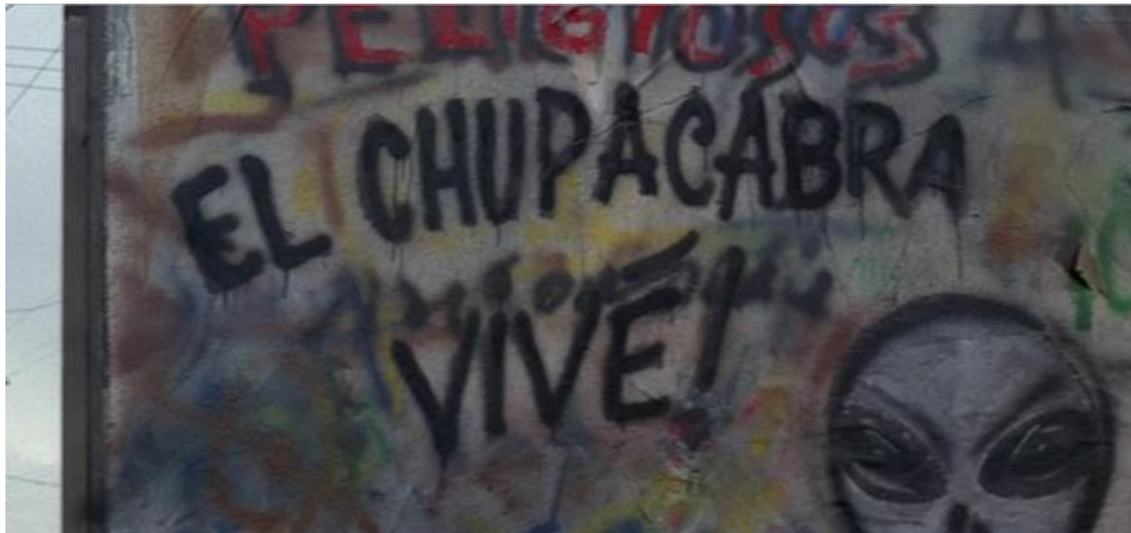
Fig. 1.1. El graffiti en un campo de obreros migratorios. The X-Files , 1997. “El mundo gira”.

“ I believe these people. But their lives are small. So they have to make these fantasies just to keep on going - to feel alive. Because they are strangers here. They feel hated, unwanted. Whenever their passions become inflamed, they resort to violence. And then they cannot turn to the law, so they make up these fantastic tales.”