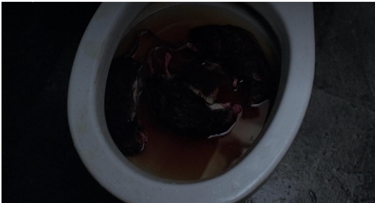
Fig. 4.2 Ratas muertas encontradas en los inodoros del museo de historia natural, donde se conservan los restos de una chamana ecuatoriana. The X-Files , "Teso dos bichos" (1996).

“Teso dos bichos” comienza en el “altiplano ecuatoriano” en un sitio de excavación arqueológica nevada; los obreros encuentran el esqueleto de una mujer chamán incaica, pero mientras que los trabajadores protestan contra la perturbación de su cuerpo, el investigador principal estadounidense dice que “no vamos a perturbarla, la vamos a rescatar”. Inmediatamente, el episodio ha establecido una jerarquía entre el poder científico extranjero que reclama el control sobre las tierras y los recursos y personas indígenas; también es posible argumentar que esta escena es una referencia al cuerpo femenino indígena, utilizado como propiedad por la invasión de las fuerzas de conquista. El investigador sostiene que a la chamana no se le puede robar o secuestrar de la tierra, sino que se le salva de la barbarie y salvajismo de su cultura de origen. La siguiente escena refuerza más esa jerarquía: el investigador principal trabaja en su oficina improvisada y